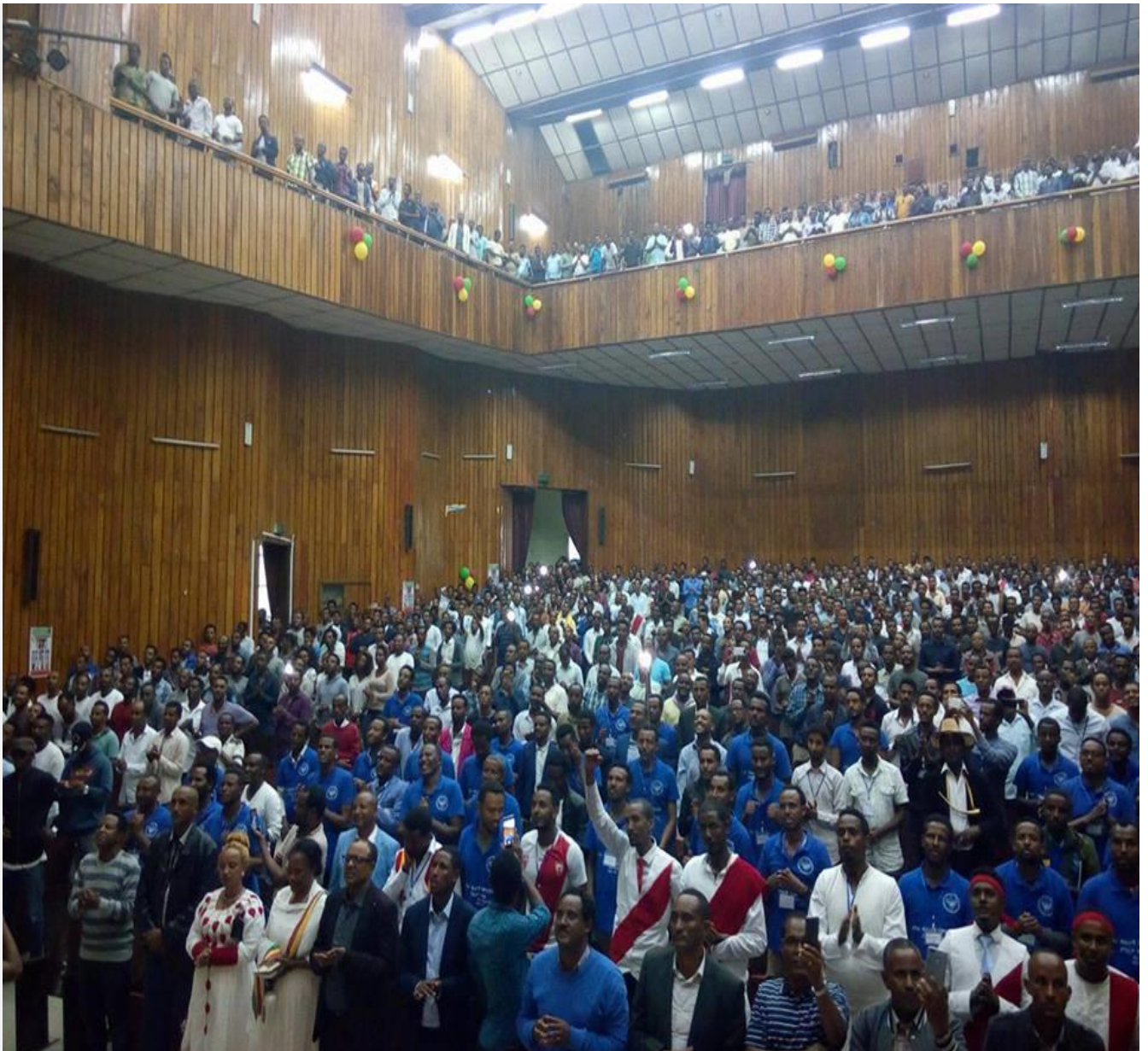
የአማራ ብሄራዊ ንቅናቄ መስራች ጉባኤ በህርዳር ሰኔ 3 2010 ዓም

ኢትዮጵያም ውስጥ በውጭም ያሉ ብዙ ሀይሎች ለአማራ መደራጀት እጅግ ድንገተኛ ናቸው። በእንስሳት አለም ውስጥ አንበሳ ወደ ሜዳው ሲገባ ድኩላ መደንገጡ ተፈጥሯዊ ነው ። አማራ ተደራጅ ሲባል መደንገጡና መርበትበቱ የዛሬ ጊዜ እውነታ ብቻ ሳይሆን ታሪካዊ መሰረትም አለው።