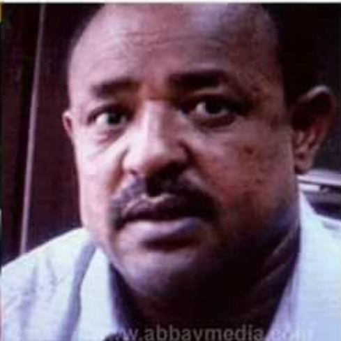
ጀነራ ተፈራ ግዋ